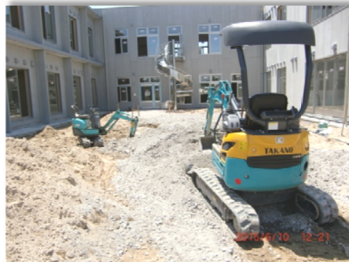
(↑ 東側中庭:6月10日撮影)