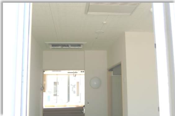
(北棟1階東側居室:6月10日撮影)

外部では、エコ給湯機の土台設置や北棟と南棟の間、東側の中庭の整備も行われています。