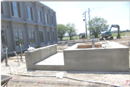
(エコ給湯土台:6月10日撮影)

北棟は、壁や床などの内装工事も仕上げの作業に入っています。特浴のタイル工事も完了しています。今後オージー技研製の介護浴槽が設置されます。来週号では、様々な仕上がりつつある室内の様子を紹介したいと思います。