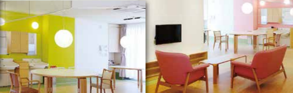
C 共同生活スペース (リビング・キッチン・団らんコーナー)

職員と共にご飯を炊いたり味噌汁をつくらしたり、ソファでゆったりくつろぎテレビを見たり、家庭的な雰囲気大切にしています。