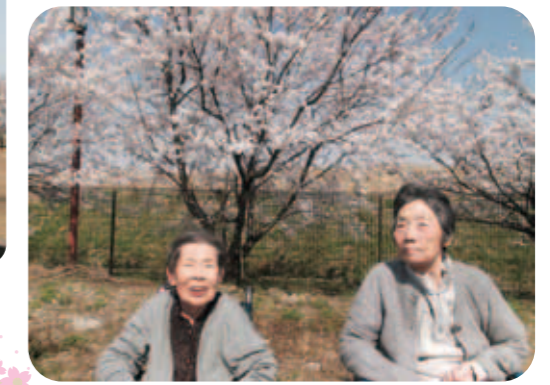
桜を見ると心も和みます。