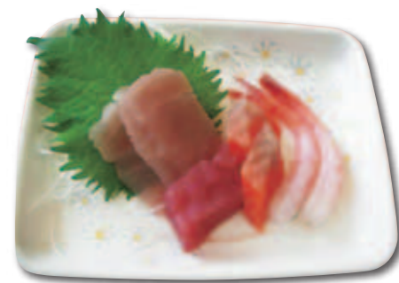
4月1日の昼食です。 お刺身でお祝いしました。