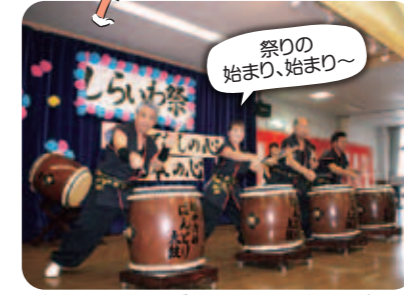
軽快な太鼓のリズムで祭りは大盛り上がり。