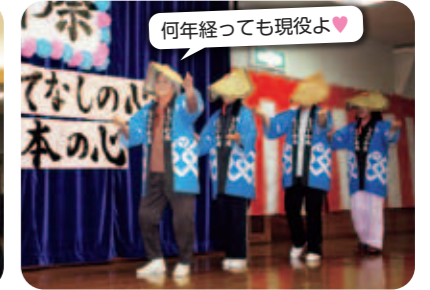
「おわら」でみなさんをおもてなし。