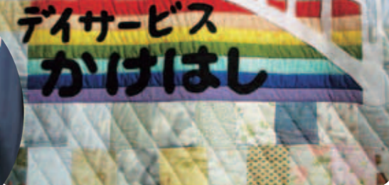
利用者様が協力して作成しました。