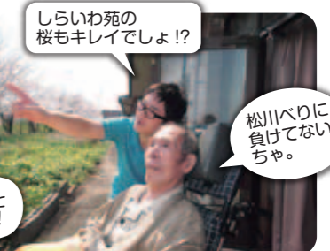
しらいわ苑の桜もキレイでしょ!?