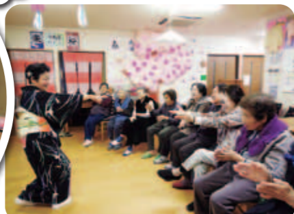
誕生会イベント！思い出が残ります。イエーイ