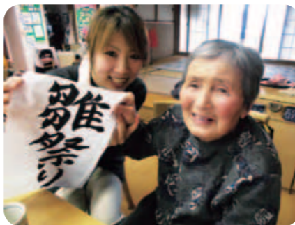
節句のお祝いをしました。 お習字や桜餅作りでお祝いました。