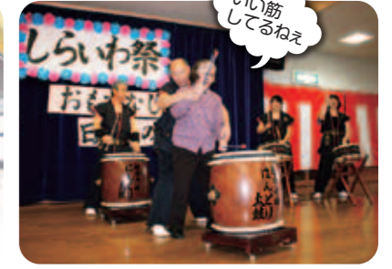
即興で仲間に入れてもらいました。