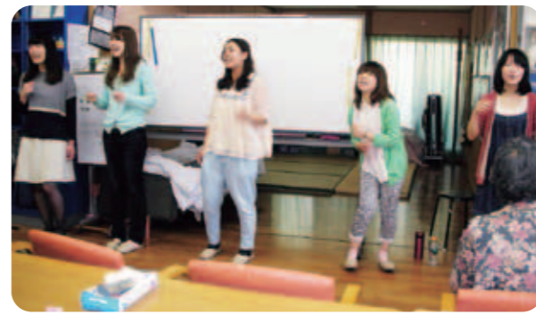
大学生のボランティアさんです。 ボイスパーカッションを披露して下さいました。