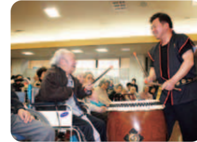
利用者さんもノリノリです。