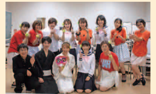
スタッフ一同お待ちしております