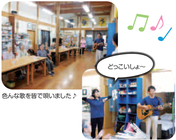
色々な歌を皆で唄いました♪