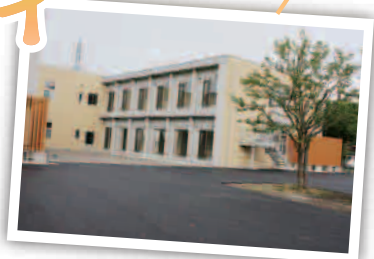
会場のこもれび正面駐車場