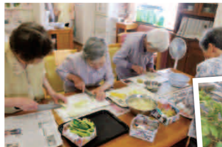
一人一役で調理しています。