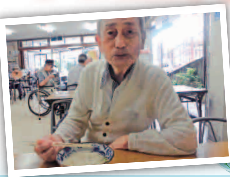
大岩山 日石寺にて