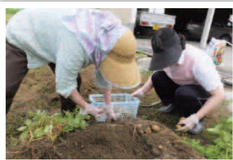
土がいいから、おいしいじゃがいもに育つんです。