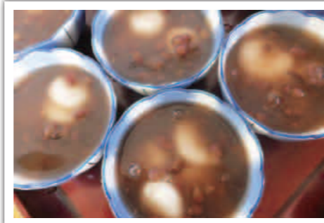
甘くておいしいやすらぎの手作りスイーツ♥

今年の夏も、セミの鳴き声に負けないよう、笑い声の絶 えない時間を皆さんとすごしていまーす♪