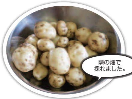
隣の畑で採れました。