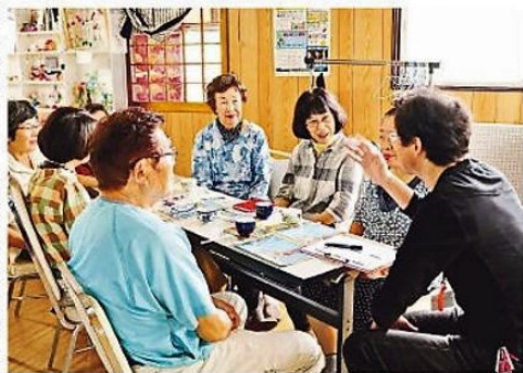
認知症の人への対応について話し合った座談会