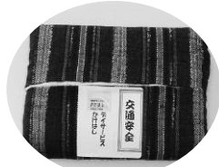
手作りのティッシュケースです。

5月19日（木）、水橋交通安全センターを通じて、「シートベルトキャンペーン」に参加しました。地域に協力させて頂くことと、利用者さんの生きがいづくりを目的に、今年で3回目の参加になります。当日は、街頭に