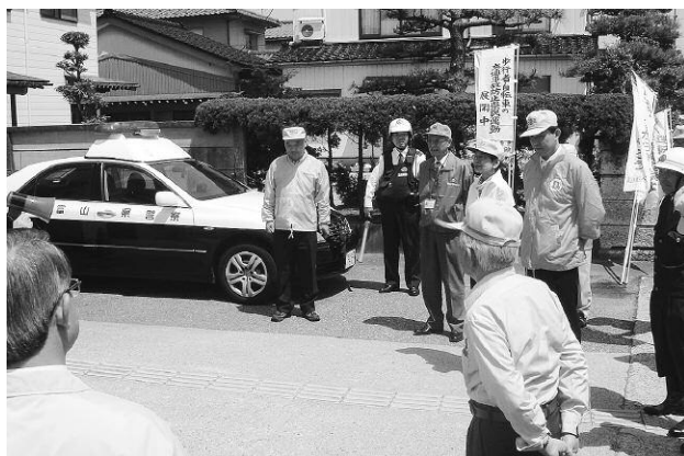
一人ひとりが交通安全の意識を持ちましょう