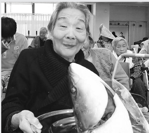
大きなブリにカブリつき（笑）

「富山といえば、ブリでしょう」という利用者の声から、ブリの解体シヨールを行いました。目の前でさばかれたブリをみた後は、もちろんお刺身で美味しく頂きました。