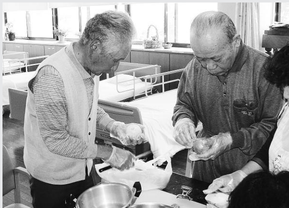
男のこだわりカレーです。

デイサービス・シヨートステイでは、毎月一回、利用者の手作りカレーを始めました。カレーはおいしくつになられても好評のメニューで、男性利用者も調理をしてくださいました。