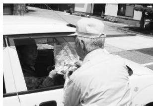
シートベルト頼んますちゃ