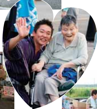
浴衣男子と笑顔 で2ショット