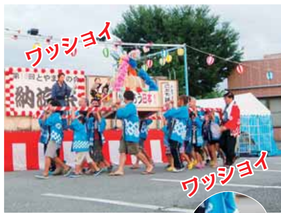
3位だけれども皆で頑張りました