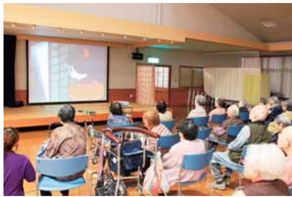
大スクリーンの迫力に、「映画館みたいやちゃ」と大変評判です。ポップコーンを準備しないと(笑)

状が授与されました。赤団(2階)青団(3階)もトロフィーこそ逃しました。ロフイーこそ我を忘れて、秋空のもと我を忘れて興奮されたり、心地よい風を感じたりされたことで良い気分転換になったのではないのでしょうか。また当日は9月の誕生者の紹介もあり参加者全員から「おめでとう」と祝福の声が上がりました。皆さんがこれからもお元気に過ごして頂けるよう、全職員で支えて行ければと思います。