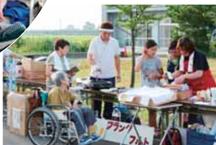
今年もたくさんの方が協力してくださりました