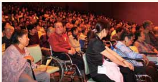
300名を超えるご来場がありました。