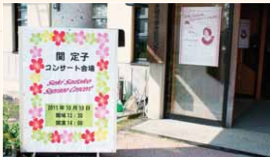
当日は晴天に恵まれました。