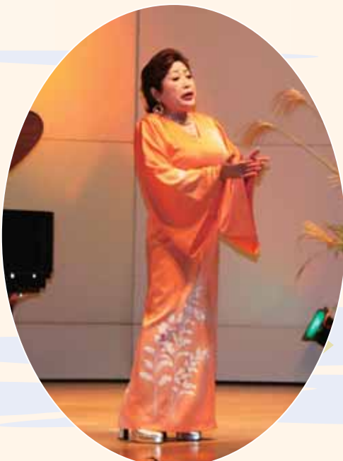
透き通るような美しい響きに癒されて…