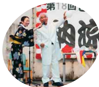
白いタクシードで手品 かっこよすぎです!