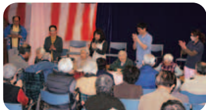
最高齢の方と喜寿、米寿のお祝いをしました