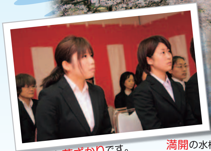
こちらも花ざかりです。