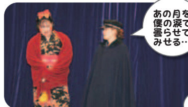
新人職員二人による金色夜叉