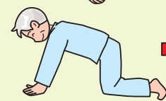
まず四つ這いになります。