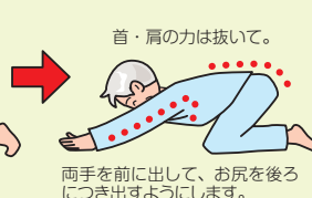
首・肩の力は抜いて。