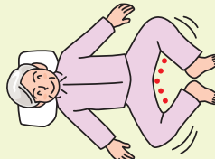
両膝を立てた状態から外に開きます。痛みのある場合は無理に開かないように。