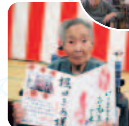
職員から白寿のお祝いの色紙が贈られました!ご家族さんもお祝いに参加されました。