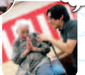
「自分で出来る事は何でもい、皆さんに感謝することです」と手を合わせて答えて下さいました。