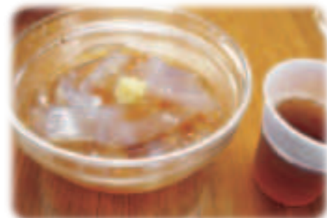
大岩と言えばそうめんだけど、ところんも美味!

毎年、年間行事として8月中旬から9月上旬にかけて上市町大岩日石寺への外出会を企画しています。利用者様もとても楽しみにされている行事の一つで、多くの皆さんが参加されています。