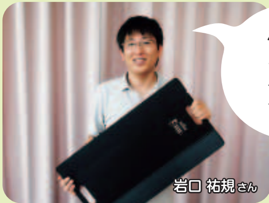
新しいスライディングボード

昨年度に引き続き、今年度も「腰痛予防研修」及び「腰痛予防指導者育成研修」に職員が参加しています！