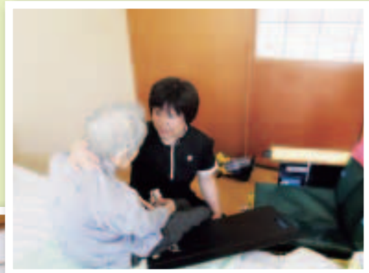
スライディングボードを使って移乗しています。